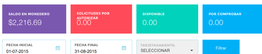
GASTOS POR CONCEPTO